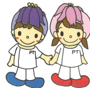
ピー太君とピー子ちゃん