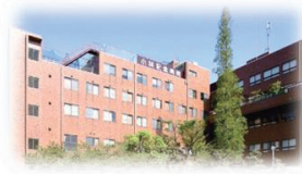
小林記念病院の外観写真

医療法人愛生館小林記念病院 https://aiseikan.xsrv.jp/01/