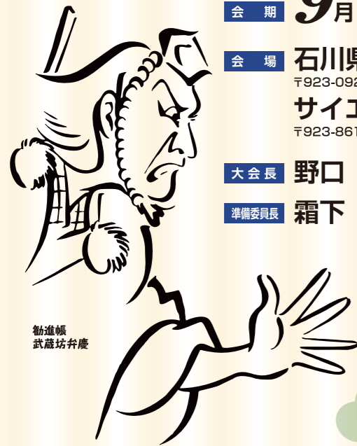
勸進帳 武蔵坊弁慶